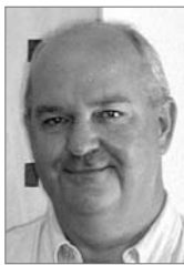
Text und Abbildungen: Siegmund Görtges, Erbslöh Geisenheim AG

Die während der Gärung entstehenden leichten Schwefelwasserstoffböckser verflüchtigen sich meist mit den entweichenden Gärgasen oder beim Abstich von der Hefe oder bei geringem Luftkontakt. Stärkere und dauerhafte Böckser bilden sich oft während der Lagerung der Jungweine. Eine Beseitigung dieser unerwünschten Fehlparmen, bei gleichzeitiger Erhaltung der gewünschten Weinaromen, stellt für jeden Kellermeister eine Herausforderung dar. Eine erfolgreiche Behandlung mit Silberchlorid-Präparaten (Sulfidex und Ercofid) war in verschiedenen Ländern lange Zeit zugelassen. Auch hartnäckige Böckser konnten damit behandelt werden. In der Schweiz war eine elektrolytische Silberung mit dem Katadynverfahren erlaubt und wurde mit Erfolg angewendet. Beide Verfahren führten jedoch zu einer Erhöhung des Silbergehaltes im Wein und häufig zu nachfolgenden Trübungen und zu unerwünschten Bittertönen. Eine Blauschönung war zur Absenkung des Silbergehaltes erforderlich.