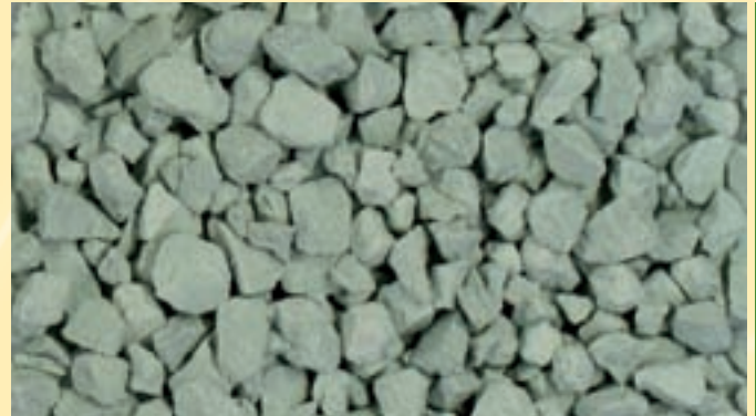
Kupzit® (2% Kupfercitrat mit Bentonit granuliert)