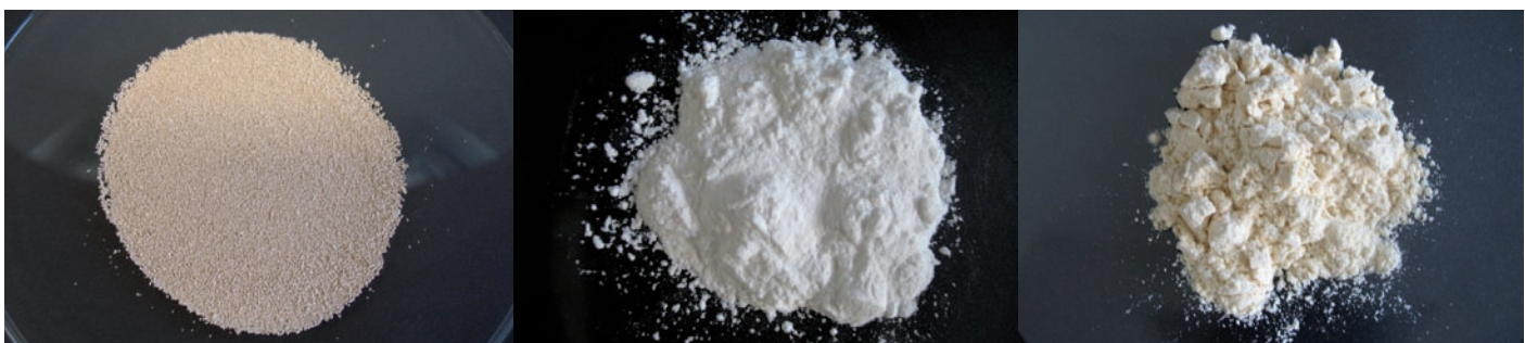
Abb. 4: Oenologische Produkte mit einem nachhaltigen Zusatznutzen: (von links) Weinhefe Oenoferm® Bio, Filterzellulose CelluFlux® und Pflanzenprotein FloraClair®